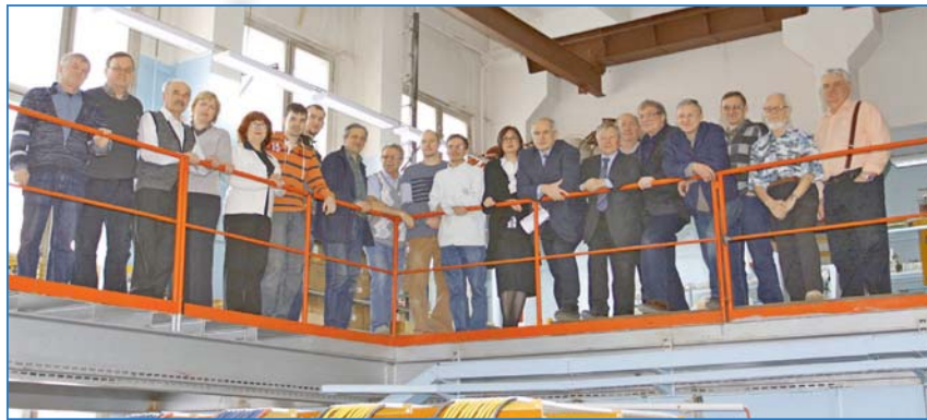
Группа сотрудников лаб.9-0, лаб.1-4 и НКО, разработавшая инжектор.