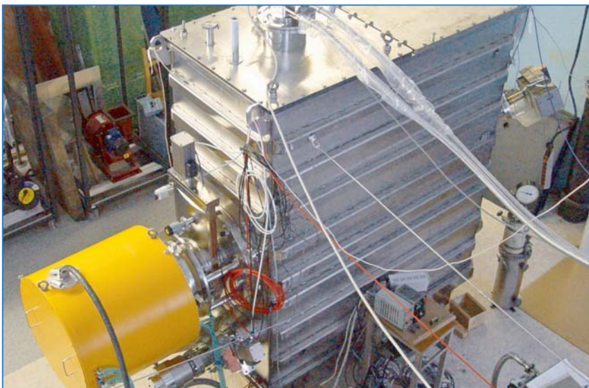
Инжектор нейтральных пучков производства ИЯФ СО РАН.